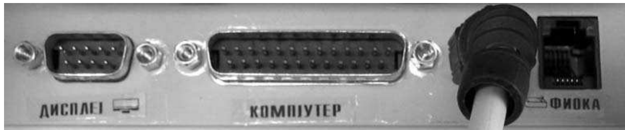
Прикључци штампача ISKRA-S 29

Штампач ISKRA-S 29 може да се користи само ако је повезан са PC на ком је инсталиран одговарајући софтвер. Уз штампач се може користити додатни дисплеј и фиока за држање новца. За сваки од уређаја постоји извод (прикључак) са задње стране штампача. Изводи су приказани на следећој слици.