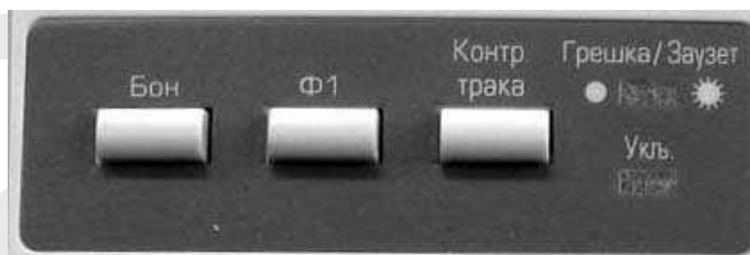
Тастатура штампача ISKRA-S 29

Изглед тастатуре штампача ISKRA-S 29 приказан је на следећој слици.